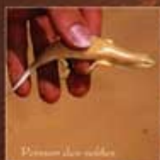
Pincement dans le sable