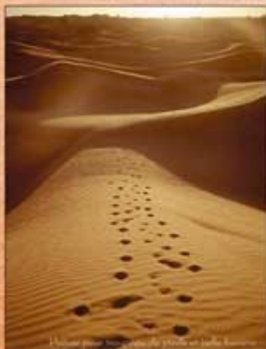
L'heure pour trouver du pain et de la bouillie

La chaleur n'aidant pas à la goinfrerie, l'alimentation solide est principalement du type grande endurance, en tenant compte du fait que, par grosse chaleur, il faut se faire violence pour absorber une certaine quantité de sucres lents par jour. Plus facile à préparer et ingurgiter le soir, à base de céréales complètes enrichies de protéines de soja, la mixture ne doit pas nécessiter trop d'eau pour sa cuisson.