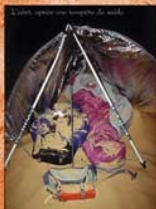
L'abri, après une tempête de sable.