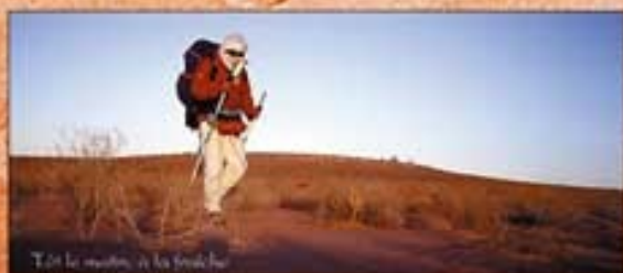
Tout le matériel, à la française.