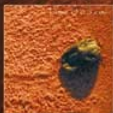
Pincement dans le sable