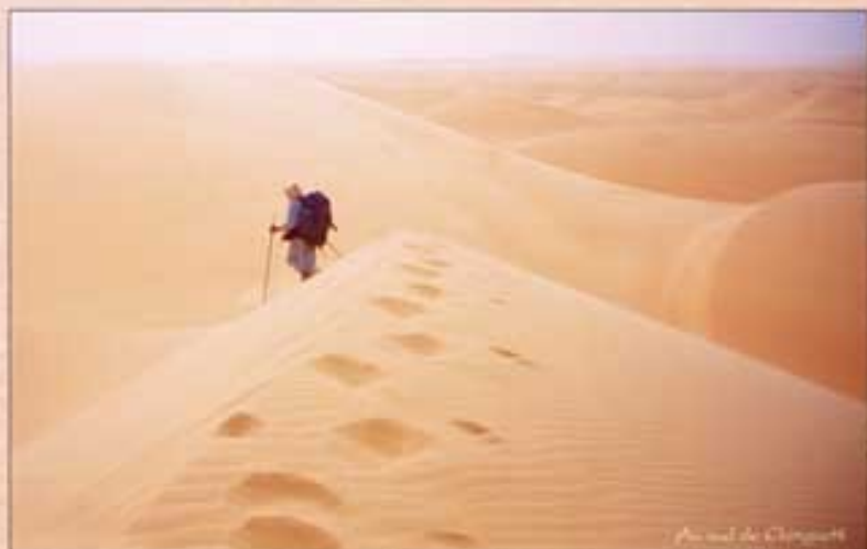
Avec du Climat

Créé et fabriqué par un suisse, cet "ustensile" fabuleux est capable de porter une trentaine de kilos sans écraser de fatigue le trekeur-trocteur ; ce qui, avec une quinzaine de kilos supplémentaires sur le dos, m'autorise la réalisation de ce projet, jusque là impossible sans chameau. Cet aspect "bidouille" peut sembler décalé comparativement aux prises de risques apparentes, mais la réussite d'un projet dépend précisément de la bonne conception de ces "bidouillages". L'imagination, l'étude technique et le bricolage sont les premiers pas vers le rêve.