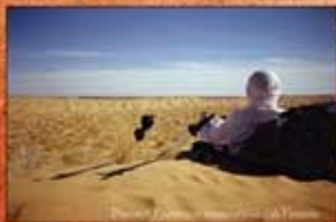
Le petit déjeuner

Plus sympa : au réveil, enfoui et immobile au fond du duvet à cause du froid de la nuit, je pu observer une curieuse petite gerboise qui passait et repassait devant l'ouverture laissée pour l'aération, intriguée par la bête qui occupait ce drôle de terrier. Service d'étage?